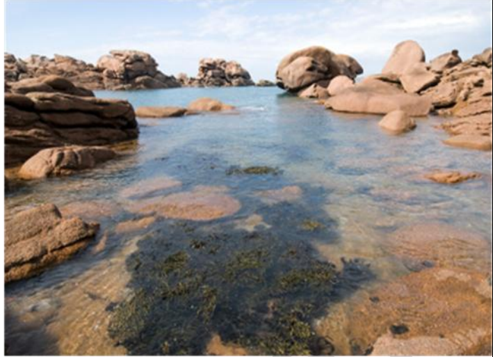
منظر لصخور الكرانيت.