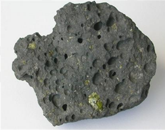
عينة من صخرة البازلت