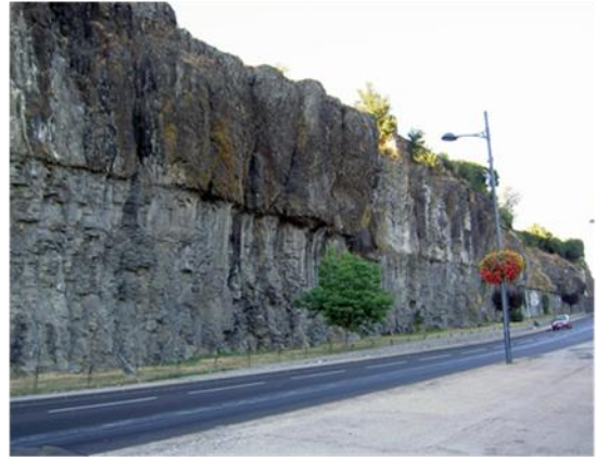
منظر عام لصخور البازلت

صخرة داكنة، صلبة خشنة كثيفة. تحتوي على بلورات كبيرة (الأوليفين والبيروكسن) وعلى عجيين.